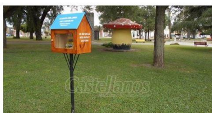
Se puso en marcha el proyecto "La Casita del Libro" La iniciativa tiende a incentivar la lectura en la comunidad. DIARIOCASTELLANOS.NET

Proyectos similares: La casita del libro y Cabina en Ingeniero Maschwitz, Provincia de Buenos Aires.